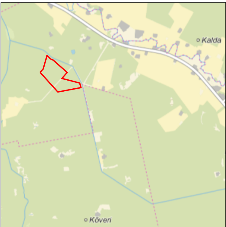
Kaardileht nr 5314 Häädemeeste, 5332 Pärnu